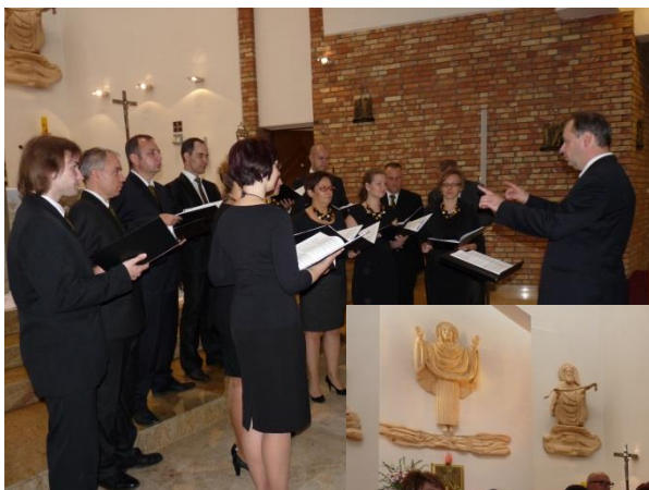
Chór ze Szczecina.

Nasz chór parafialny nie wziął udziału w koncercie.