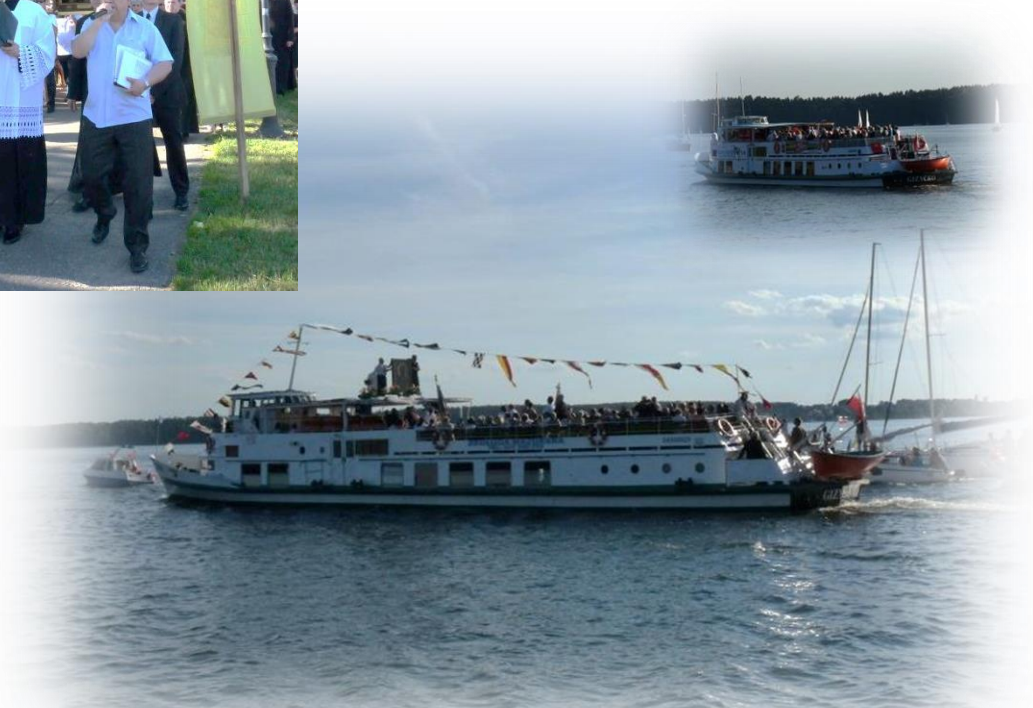
Statek „Tałty” z obrazem Matki Boskiej Jasnogórskiej na pokładzie, w towarzystwie eskorty honorowej, na wodach jeziora Niegocin.