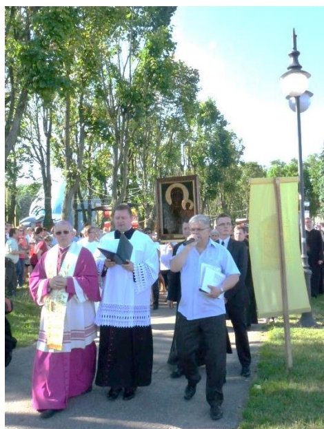
Orszak w drodze do portu Żeglugi Mazurskiej.