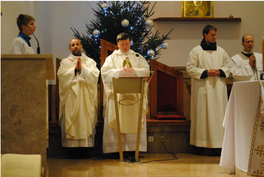
Kapłani podczas sprawowania Bożonarodzeniowej Eucharystii...