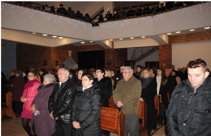
Licznie przybyli wierni śpiewają radośnie: „Gloria,